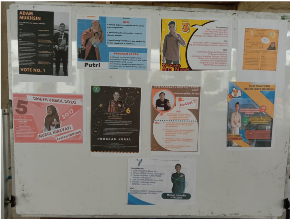
Foto 2: Papan tulis yang berisi informasi Calon DPM FH Unmul 2019